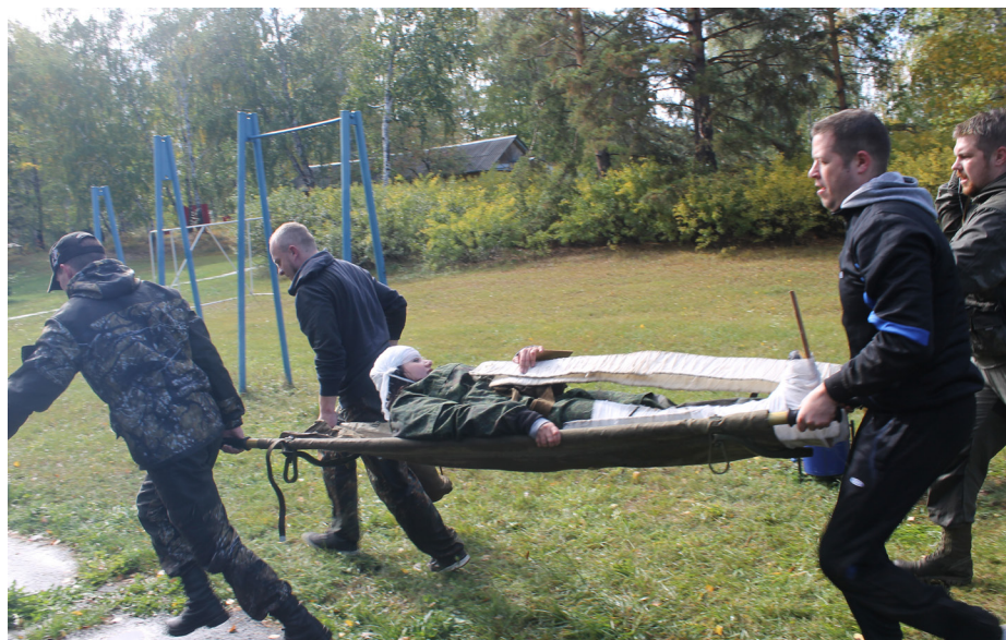
В бою всегда случаются ранения, и надо уметь помочь пострадавшему