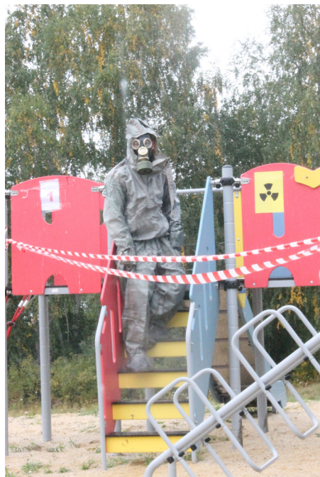
В «зараженный район» войти можно только в полной экипировке